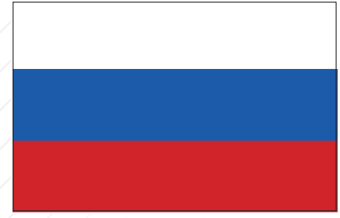
ГОСУДАРСТВЕННЫЙ ФЛАГ РОССИЙСКОЙ ФЕДЕРАЦИИ

Государственный герб Российской Федерации представляет собой изображение золотого двуглавого орла на красном щите. Над орлом в центре находится корона — скипетр и держава, на груди — на красном щите — белый всадник, поражающий копьем дракона. Одна голова орла смотрит на Восток, другая на Запад. Всадник, поражающий дракона, символизирует идею борьбы добра со злом, света с тьмой.