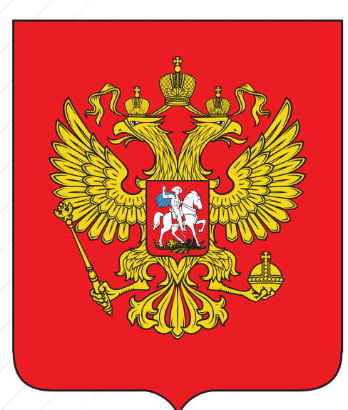
ГОСУДАРСТВЕННЫЙ ГЕРБ РОССИЙСКОЙ ФЕДЕРАЦИИ

Государственный герб Российской Федерации представляет собой изображение золотого двуглавого орла на красном щите. Над орлом в центре находится корона — скипетр и держава, на груди — на красном щите — белый всадник, поражающий копьем дракона. Одна голова орла смотрит на Восток, другая на Запад. Всадник, поражающий дракона, символизирует идею борьбы добра со злом, света с тьмой.